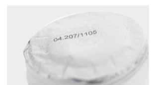
Impresión azul resistente sobre láminas de aluminio con B2025si