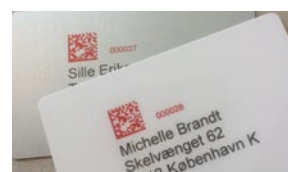
Impresión duradera y nítida sobre metal y plástico con R2021si