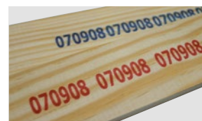
Impresiones en azul y rojo sobre madera con B2025si y R2021si

La W1250si es una tinta blanca disolvente que imprime una imagen de alta calidad con excelente contraste sobre material oscuro o transparente. Ofrece un rendimiento adecuado en materiales con revestimiento y con revestimiento acuoso, OPP con tratamiento corona, OPP no tratado, PET y otros sustratos semiporosos y no porosos. Ofrece un tiempo de secado rápido de unos pocos segundos y un tiempo de desencapsulado adecuado para ofrecer una alta productividad. La tinta blanca tiene base de pigmentos.